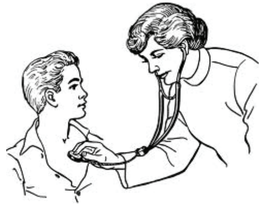
בדיקת בעזרת סטטוסקופ

כאשר הרופא מקשיב לריאות בעזרת הסטטוסקופ, הוא שומע צפצופים או חרחורים. הצפצופים מעידים על היצרות של דרכי הנשימה והחרחורים על התנפחות הרקמה הרירית ונוכחות של ליחה בדרכי הנשימה.